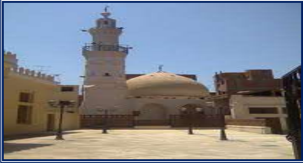
واجهة مسجد علي الروبي أحد جوانب المسجد