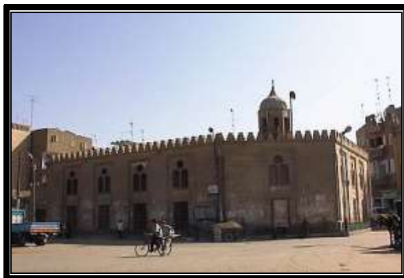
واجهة مسجد خوند اصلباي