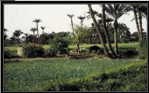
المناطق الريفية في الفيوم