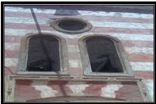
اللوحة التأسيسية للمسجد